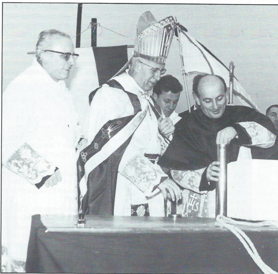
La posa della pergamena nella prima pietra